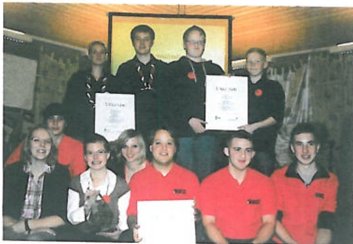
Die Preisträger der Verleihung 2011.

Außerdem erhalten alle Gruppen und vorgeschlagenen Personen eine Urkunde, sowie ein Geschenk als Dankeschön für ihr ehrenamtliches Engagement